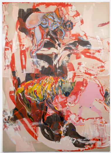
Scavenger IV, 2023

Née en 1994 à Vérone, Italie. Vit et travaille à Venise, Italie.