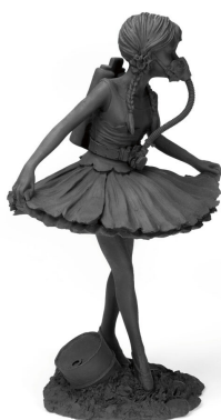
Ballerina with action man parts Résine peinte 31 x 20 x 18 cm

Né en 1974 à Bristol en Angleterre. Vit et travaille à Londres.