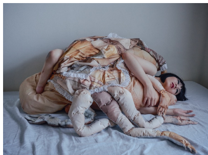
Bystander #008, 2016

Née en 1987 dans la préfecture de Saitama, au Japon.