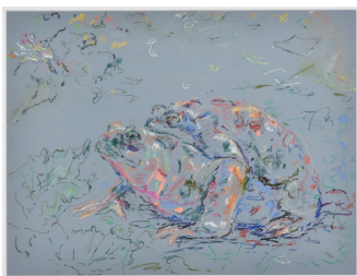
Deux princes, 2024 Pastels à l'écu et pastels à l'huile sur papier 50 x 65 cm

Née en 1976 à Helsinki, Finlande. Vit et travaille à Helsinki, Finlande