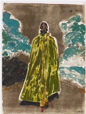
The Storm, 2017 Encre sur papier 51 x 38 cm

Née en 1981 à Pertuis, France. Vit et travaille à Los Angeles, États-Unis.