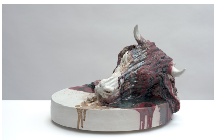
Still Life, Metamorphosis , 2021 Céramique 64 x 42 x 58 cm

Née en 1972 à Schüttdorf, Allemagne. Vit et travaille à Rotterdam, Pays-Bas