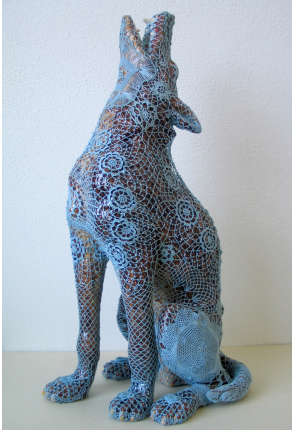
Arturo Cantiflas , 2008 Céramique et coton croché à la main 82 x 42 x 30 cm

Née en 1971 à Paris, France. Vit et travaille à Lisbonne, Portugal.