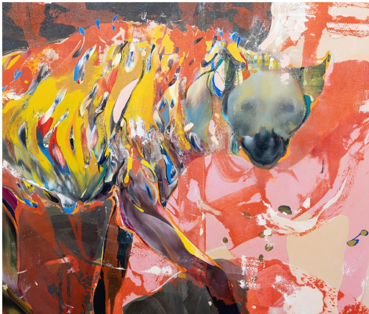
Marta Spagnoli, Scavenger IV (détail)

DU MERCREDI AU SAMEDI DE 11H À 19H, ET UN DIMANCHE PAR MOIS DE 10H À 18H